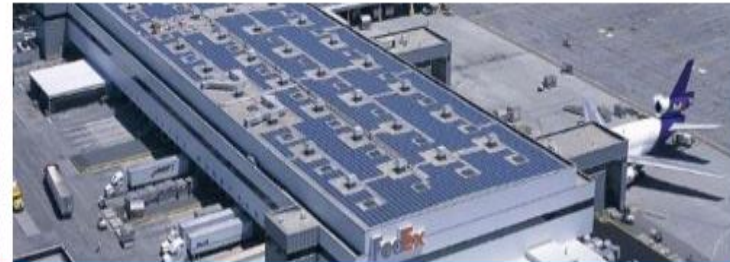
Empresas Líderes Globales