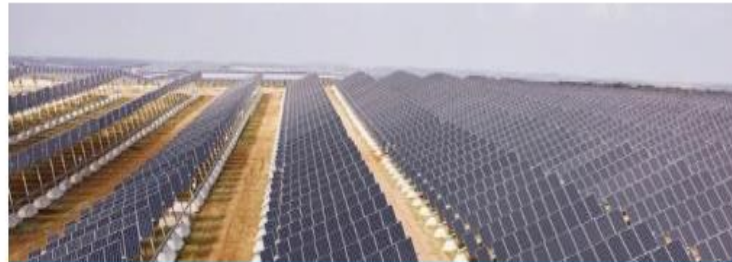
Expertos Globales en la Industria